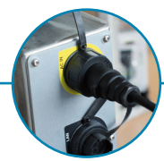
Connecteurs IP68 Serrage rapide manuel