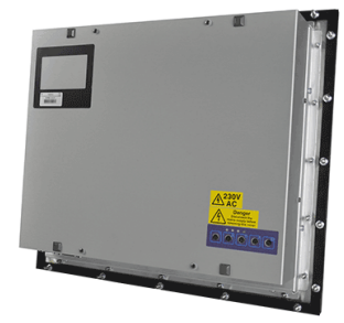
Version à encastrer

La gamme Écran industriel Inox propose une série d'écrans de tailles différentes spécialement conçus pour une utilisation industrielle . Avec leur châssis en Inox , ces écrans sont étanches et utilisables partout, même dans les environnements les plus hostiles . Leur technologie P-Cap dernier cri en font des écrans haute performance aux fonctionnalités multiples.