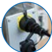
Connecteurs IP68 Serrage rapide manuel