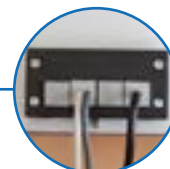
Presse-étoupes fendus, gain de temps au montage