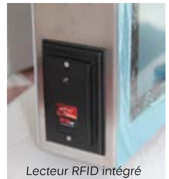
Lecteur RFID intégré

Le châssis en Inox et l'intégration de composants de qualités confèrent au produit des garanties de robustesse , de fiabilité et de pérennité . Ces matériels sont utilisés dans plusieurs domaines d'activités tels que l' agroalimentaire , la cosmétique , la chimie , l' industrie manufacturière .