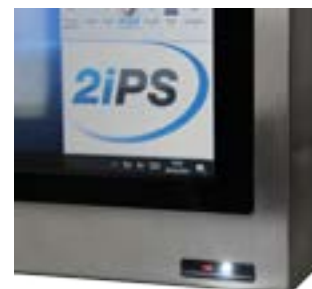
Lecteur code barre intégré

La gamme Panel PC Inox remplit la fonction d'un poste opérateur industriel équipé d'un lecteur code barre . Le châssis en Inox et l'intégration de composants de qualités confèrent au produit des garanties de robustesse , de fiabilité et de pérennité . Ces matériels sont utilisés dans plusieurs domaines d'activité tels que l' agroalimentaire , la cosmétique , la chimie , l'industrie manufacturière .