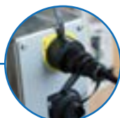
Connecteurs IP68 Serrage rapide manuel