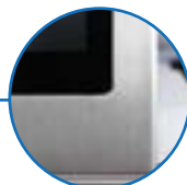
Face avant Flush supportant les lavages intensifs